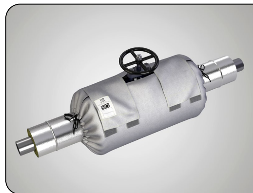
armatura s izolací a s instalací SIA