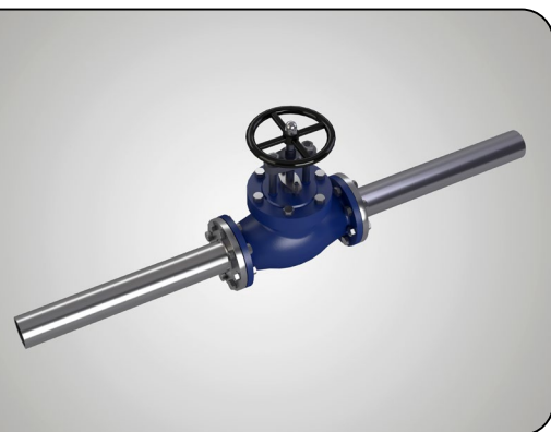
armatura bez izolace

Instalace se na zařízení provádí výhradně, pokud je mimo provoz. Na izolovanou armaturu se SIA instaluje v podélném směru, dočasně se fixuje suchými zipy, stáhne tkanicemi na konci snímatelné izolace a upraví tak, aby těsně obepínala izolovaný povrch. Na závěr se uzavře suchými zipy do koncové polohy.