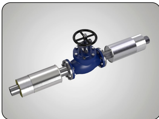
armatura s izolací